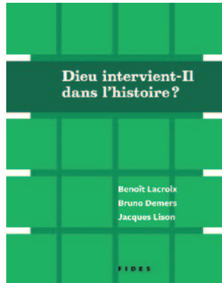
Fides • 2013 • 96 pages • 14,95 $