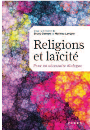
Fides • 2014 • 240 pages • 26,95 $

La collection de publications du Centre culturel chrétien de Montréal, créée en partenariat avec les Éditions Fides, regroupe des textes de conférences prononcées lors des soirées du Centre. Elle a pour objectif d'élargir la portée de nos activités, de permettre à des gens de partout de nourrir leur réflexion au contact des conférenciers que nous avons la chance d'accueillir.