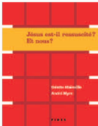
Fides • 2011 • 76 pages • 11,95 $

D'autres titres sont disponibles. Visitez notre site web pour plus d'informations.