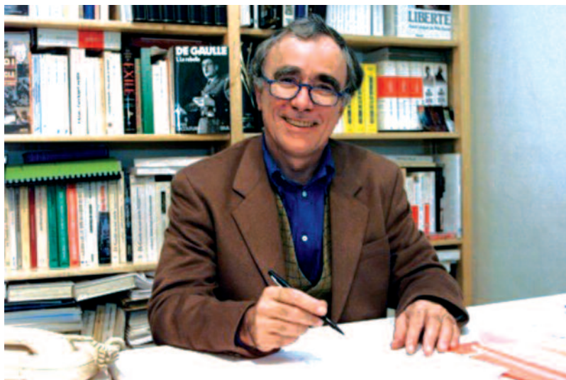
Le 6 février 2013, Jean-Claude Guillebaud, écrivain et journaliste français, présentait une conférence au CCCM sur le thème Promesses et menaces de la cyberculture.