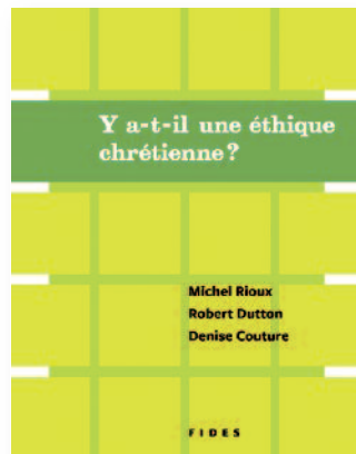
Fides • 2011 • 50 pages • 11,95 $