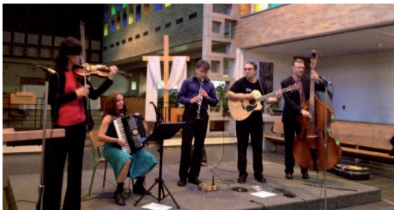
Le 10 mai 2012, dans le cadre de sa série Voix du sacré , le CCCM recevait l'ensemble de musique klezmer Kleztory.

Depuis 2003, le CCCM a organisé plus de 100 événements !