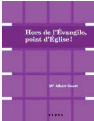
Fides • 2012 • 90 pages • 12,95 $